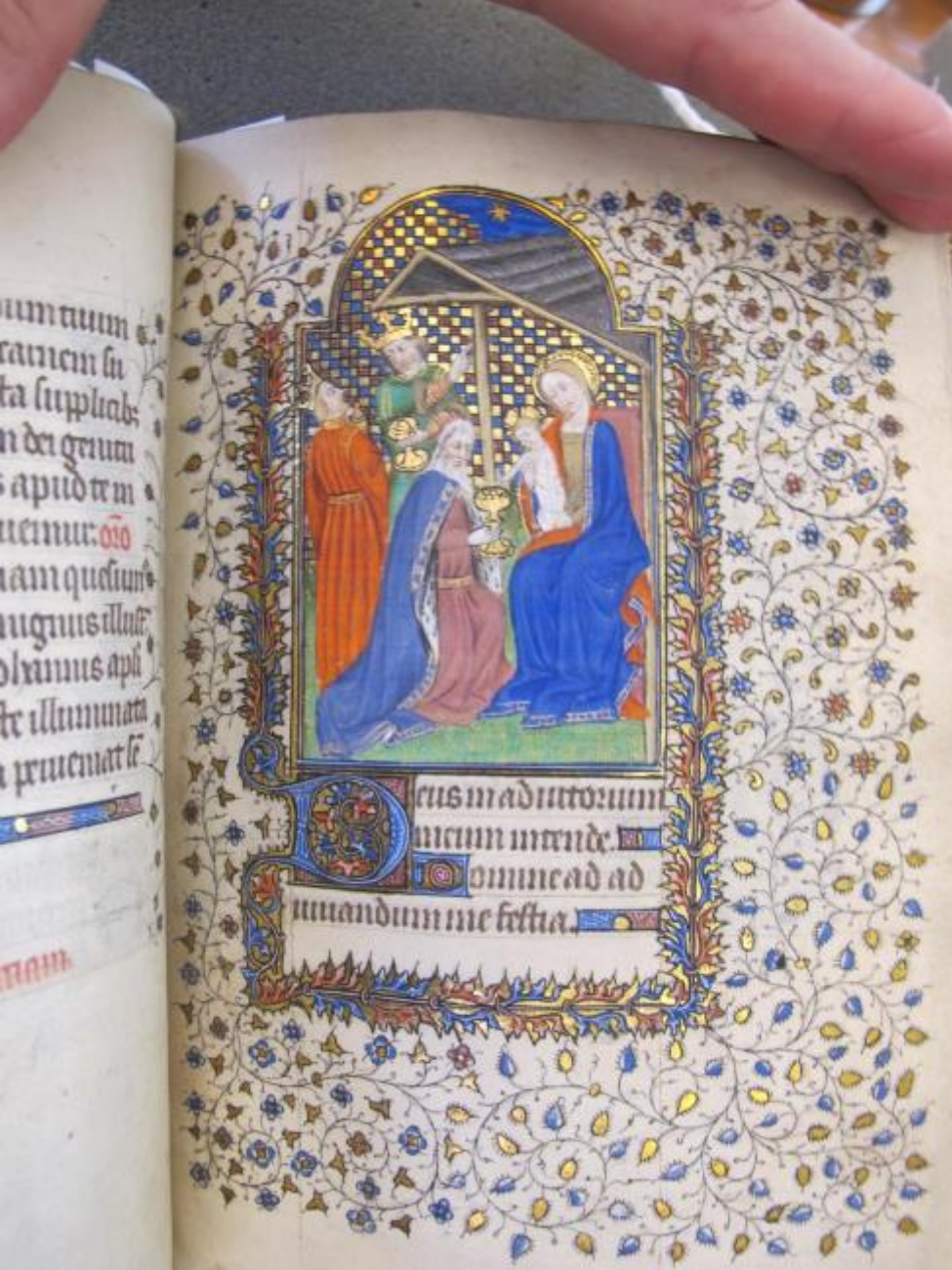
The Three Magi