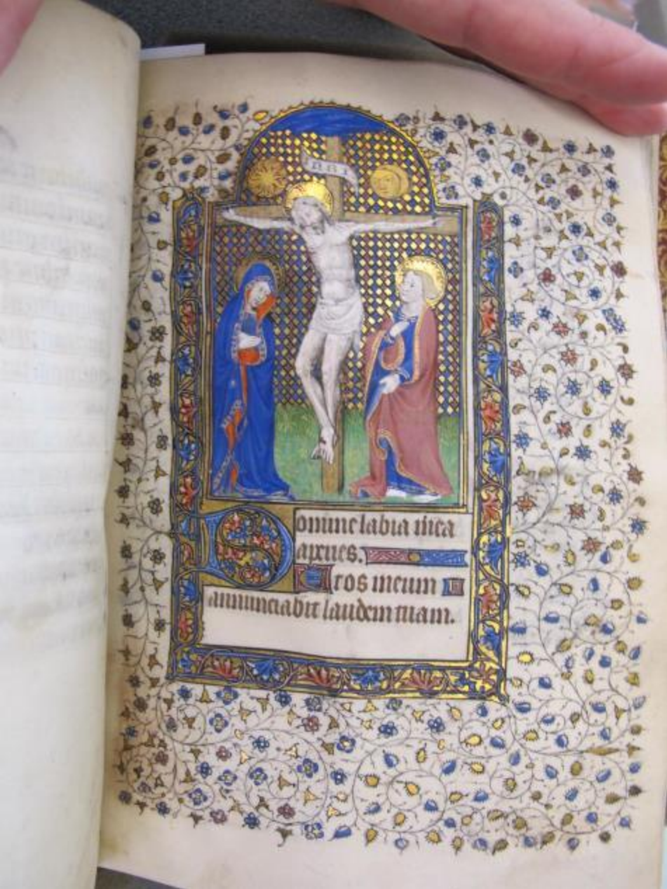
Crucifixion of Christ