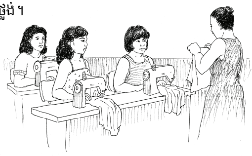
ពួកម្តាយទាំងនេះរៀនរបរកាត់ដេរសំលៀកបំពាក់ ដូច្នេះពួកគាត់អាចរកលុយបានច្រើន ធ្វើការនៅជិតផ្ទះ និងចំណាយពេលបានច្រើនជាមួយកូនរបស់ខ្លួន ។

ក្រុមរបស់ឪពុកម្តាយភាគច្រើនធ្វើការដើម្បីអប់រំសហគមន៍ទាំងមូលអំពីភាពផ្ទះ ។ ជាញឹកញាប់ពួកគាត់ធ្វើការរួមគ្នាជាមួយមនុស្សផ្ទះ ។ ក្រុមនេះប្រើសិក្ខាសាលា កម្មវិធីផ្សាយតាមវិទ្យុ ព្រឹត្តិប័ត្រ ផ្ទាំងប្រកាស រោងល្ខោនតាមផ្ទះ ផ្ទាំងរូបភាព (ប៊ូស្ត័រ) ដើម្បីជួយឱ្យមនុស្សឯទៀតយល់កាន់តែច្បាស់អំពីភាពផ្ទះ ។